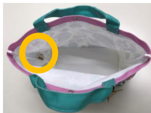
バッグ内側の表示位置