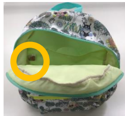
ファスナー開封時